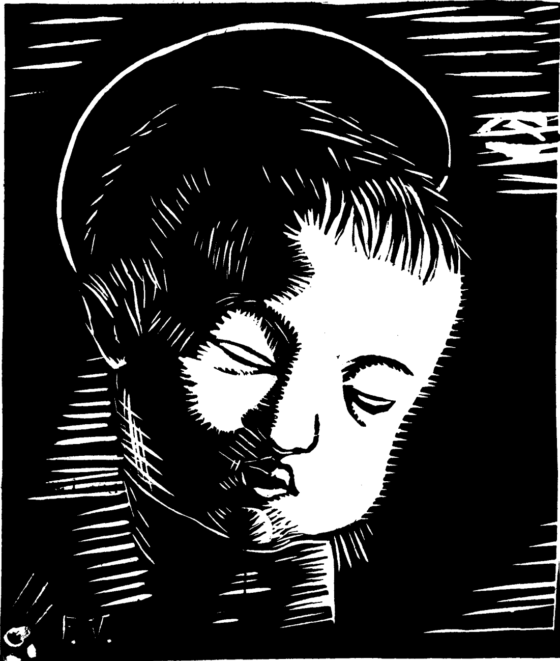
CAP DE NEN JESÚS