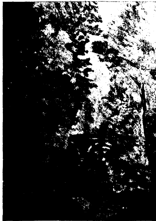
El Pont de les Mores, per la senyoreta Dolors Roca