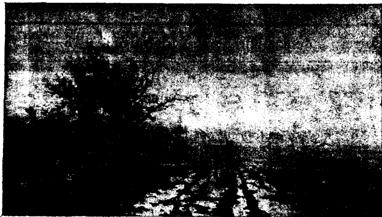
J. VAYREDA. - Paisatge.

SALA PARÈS. - Ha estat sota els millors auspicis que, aquest any, s'ha obert la temporada artística a la ciutat comtal; per bé que, de moment, sols estiguin obertes tres de les nombroses sales d'exposició.