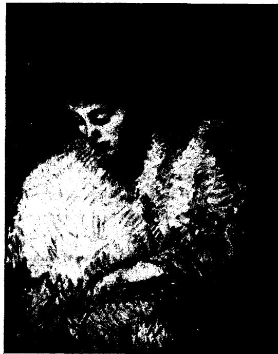
I. NONELL. - Figura.

Les demandes de subscripció poden adreçar-se al Palau de Projeccions de Montjuic.