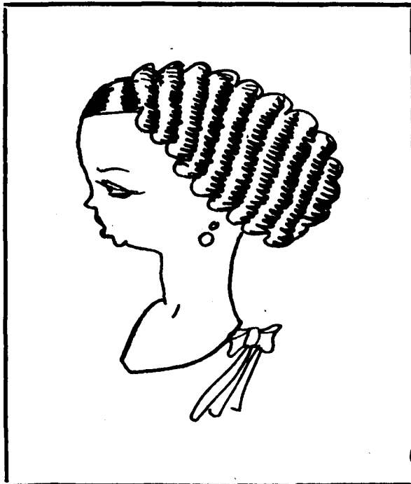
Olé la esencia, presencia i potencia de las mujeres bonitas!

Recader Puig. EL RAYO. Olot. Servei diari amb camió l'Olot a Barcelona Olot Carrer del Carme 9 (esparteria). Barcelona LA INTERNACIONAL Pau Iglesias, 11 (Abans Princesa) Telèfon 19,844.