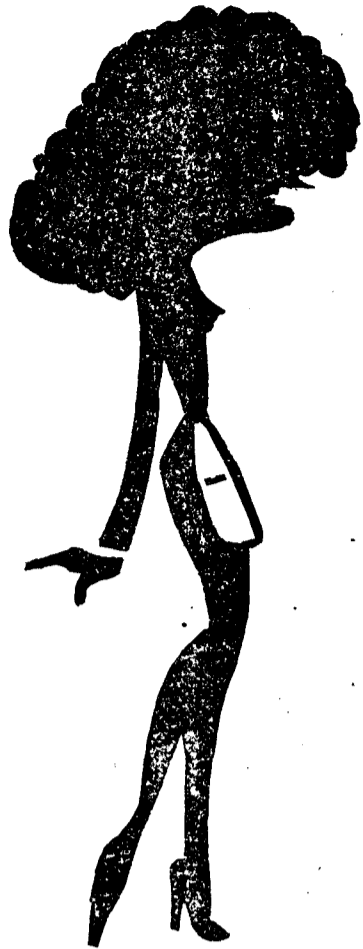
La mateixa Montserrat vista per un altre dels nostres caricaturistes. (Trieu i remaneu)