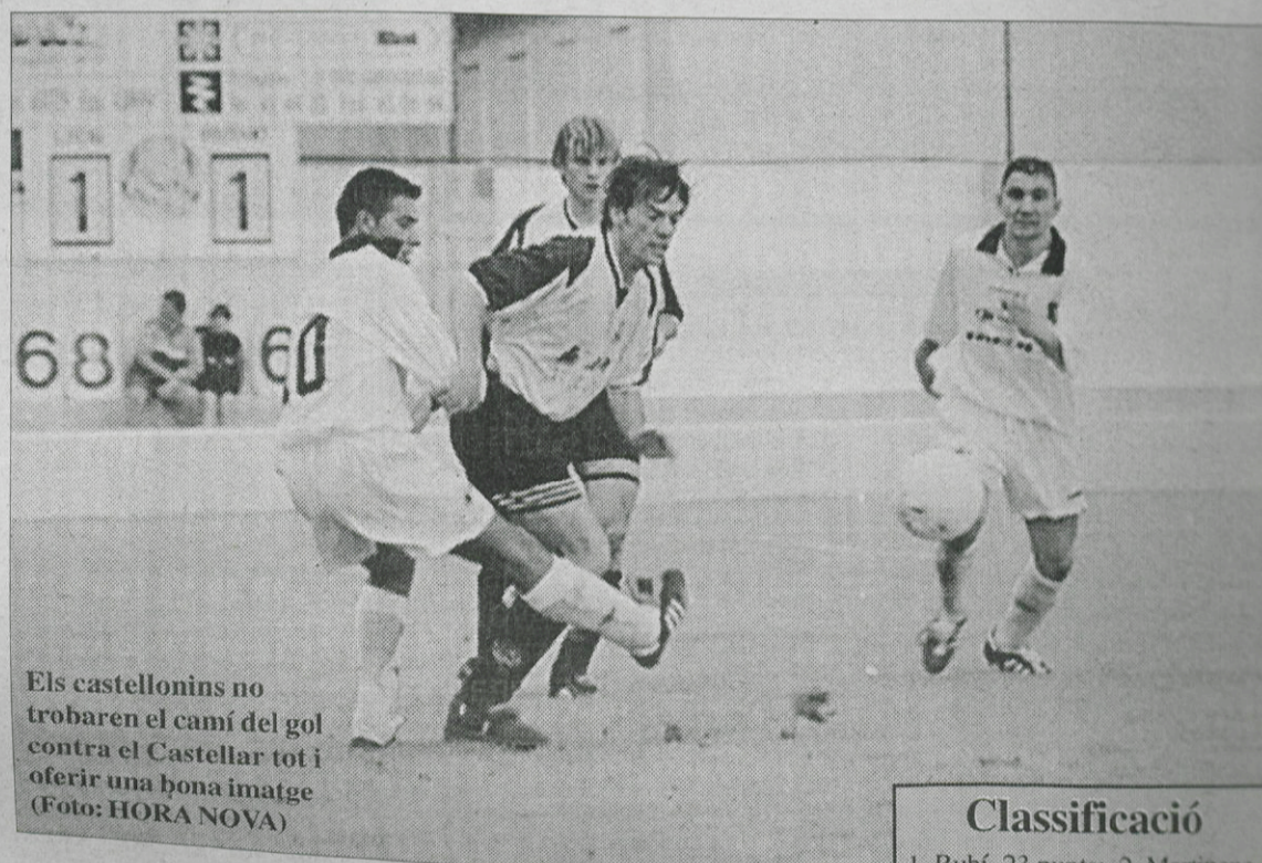
Els castellanins no trobaren el camí del gol contra el Castellar tot i oferir una bona imatge

Després d'uns primers quaranta-cinc minuts equilibrats, el Gironella va donar un cop d'efecte al desenvolupament del joc amb l'1-0, aconseguit en el primer minut de la represa. A partir d'aquí, l'Esplais intensificà el seu domini i disposà d'ocasions clares per donar la volta al marcador —un xut al pal inclòs—, però no va estar encertat.