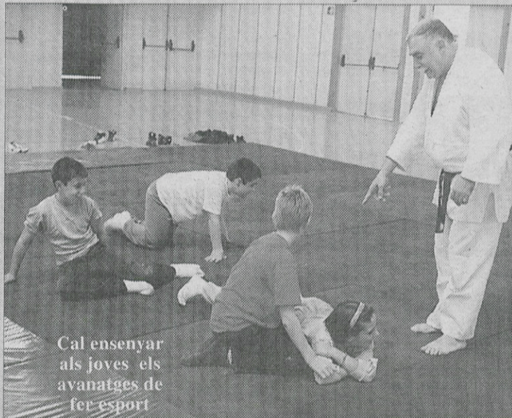
Cal ensenyar als joves els avantatges de fer esport

litat. No hem de barrejar la roba. En alguns casos, estudi i esport, en funció de l'edat, no van lligats i tampoc no caldria fer un "crit al cel".