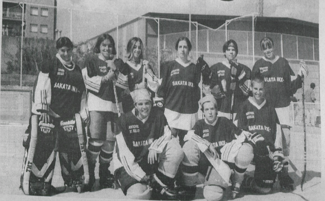
Les femines, la novetat de la temporada