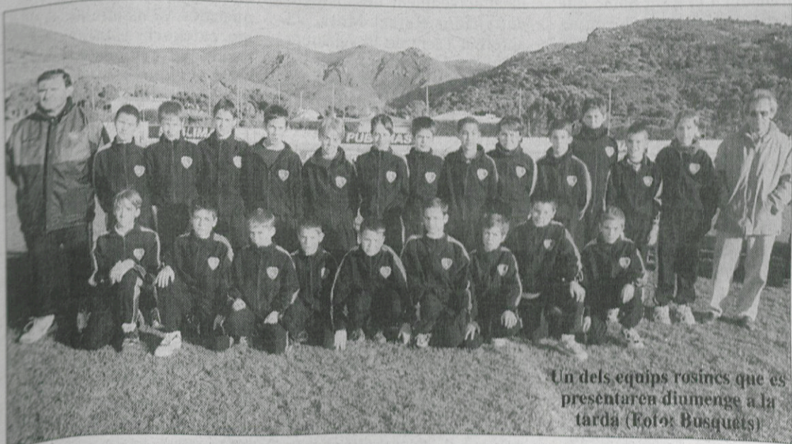
Un dels equips rosincs que es presentaren diumenge a la tarda

Enfortir els equips base per potenciar el futbol rosinc és el principal objectiu de la directiva