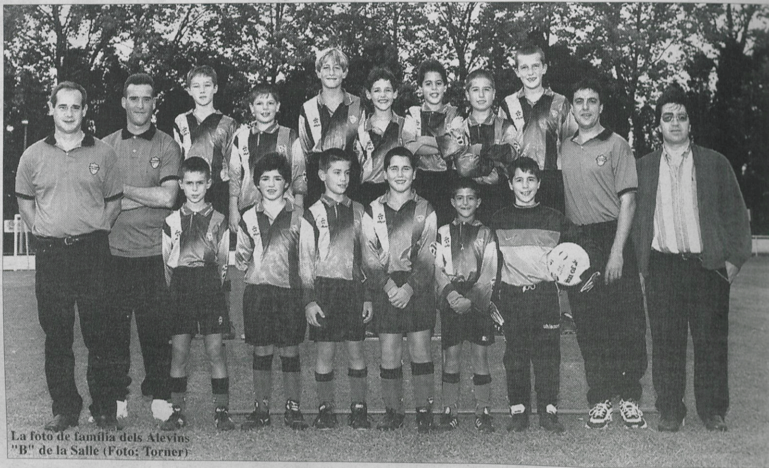
La foto de família dels Alevins "B" de la Salle

L'actitud és el principal aspecte en el qual Ferrer i Luque cen-