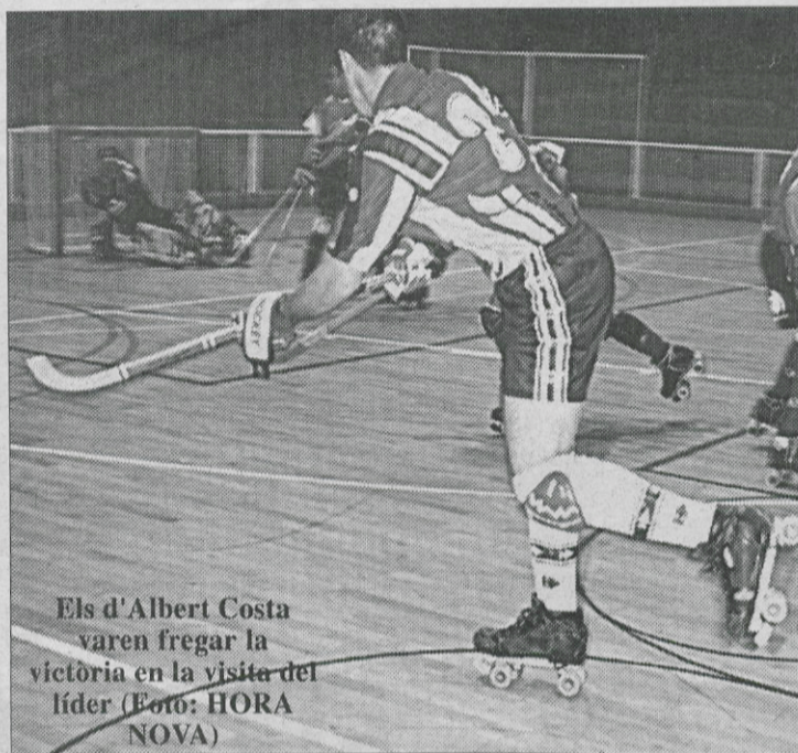
Els d'Albert Costa varen fregar la victòria en la visita del líder

Alcobendas B-Liceo B Horta-Mieres Alcodiam-Órdenes Vila-seca-Areces Bell-lloc-Traviesas Mollet-Cambrils GEiEC-Jonquerenc Plus Lleida-Cerdanyola la Cibeles-Arenys de Munt