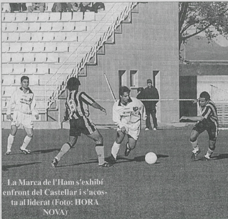
La Marca de l'Ham s'exhibí enfront del Castellar i s'acosta al liderat

Els altempordanesos varen obtenir el 2-0 en un moment psicològic (45'), després d'una gran jugada de Lavall per la banda dreta, que centrà a l'àrea i Tinto, de cap, enviaria el cuir al fons de la xarxa. La Marca de l'Ham emulava el "dream team" i la seva defensa —amb el retorn de Sabadí—, també va ser pro-