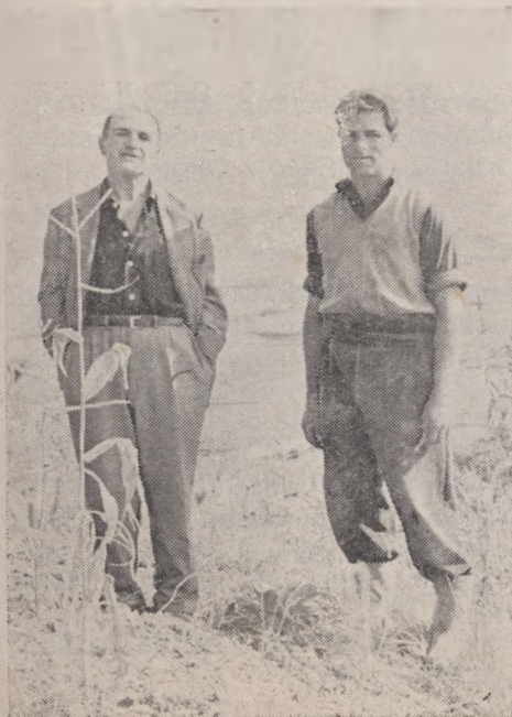
Amic de tots... enamorat de tot..

Una constant modèstia, desproporcionada als seus coneixements i a la seva capacitat poc comuns, l'elevava per damunt de la vulgaritat i fugia i es deslliurava lluny d'artificis, d'hipocresies i de falsedats.