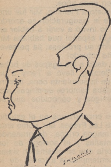
FRANCESC XAVIER RIERA