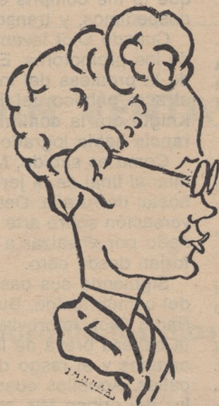
RAMON PLA Y CORAL