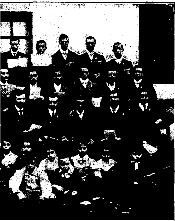
Arenys de Mar