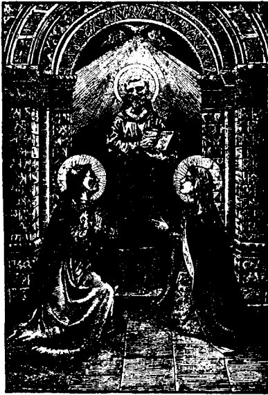
Patrons de la V. O. T.

donzelles que desitjavan menyspreuar les terrenals riqueses y concupiscencies pera seguir a Cristo pèl camí de la paupertat de esperit y poder més fàcilment guanyar victoria sobre 'ls tres enemichs més formidables del home, mon, dimoni y carn.