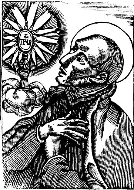
Sant PASQUAL BAILON