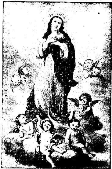
A MARÍA IMMACULADA