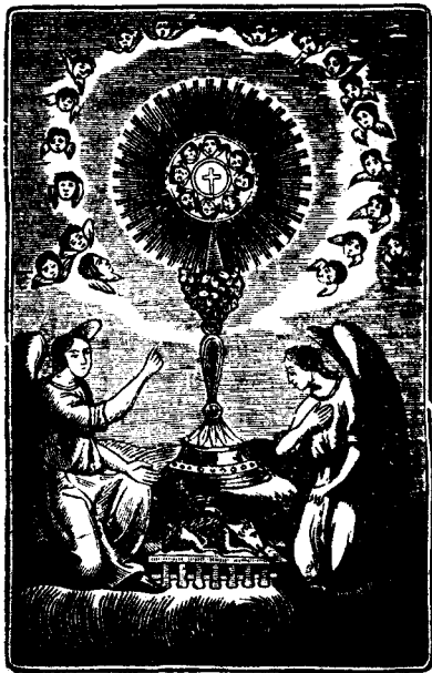
LA MISSA CANTADA PER EL POBLE