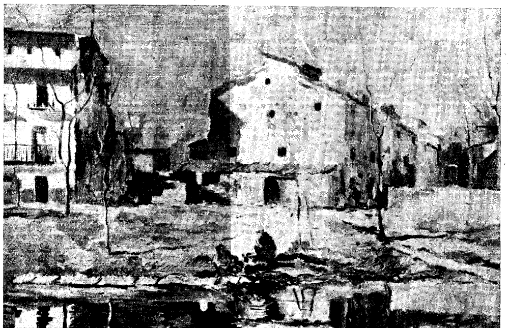
Vores de Fluvià, tela original de Josep Pujol