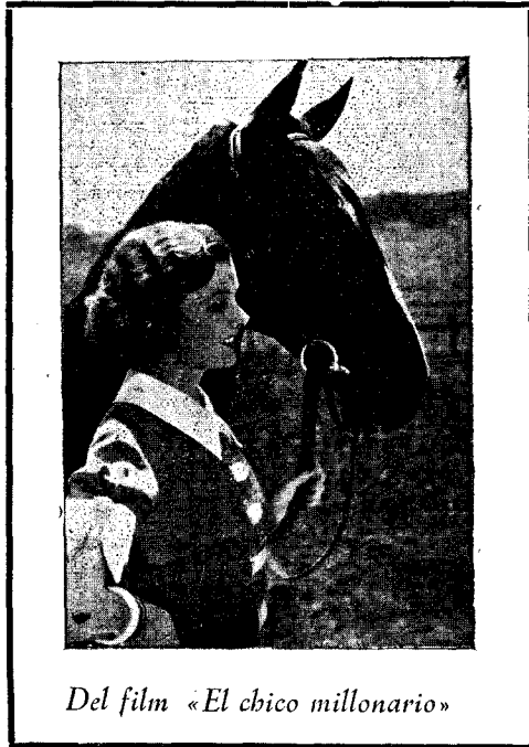
Del film «El chico millonario»