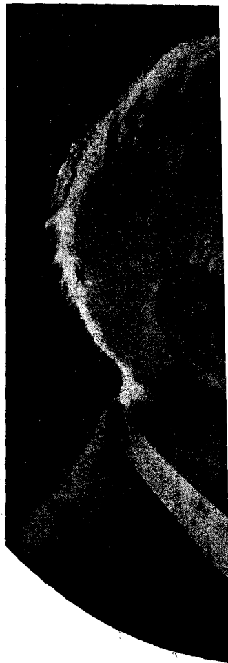
Francesc Macià i Llusa, primer