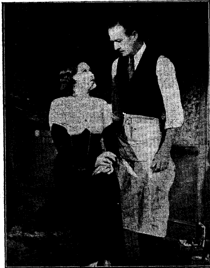
Una interessant escena del film que podreu admirar al Teatre Principal, «Sorrrell i fill».