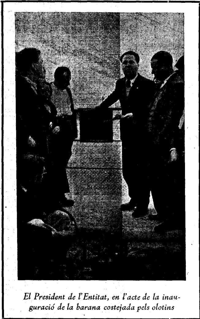
El President de l'Entitat, en l'acte de la inauguració de la barana costejada pels olotins

matí, amb tot i continuar el mateix mal temps van sortir en una expedició de nou cotxes, completament atapeïts.