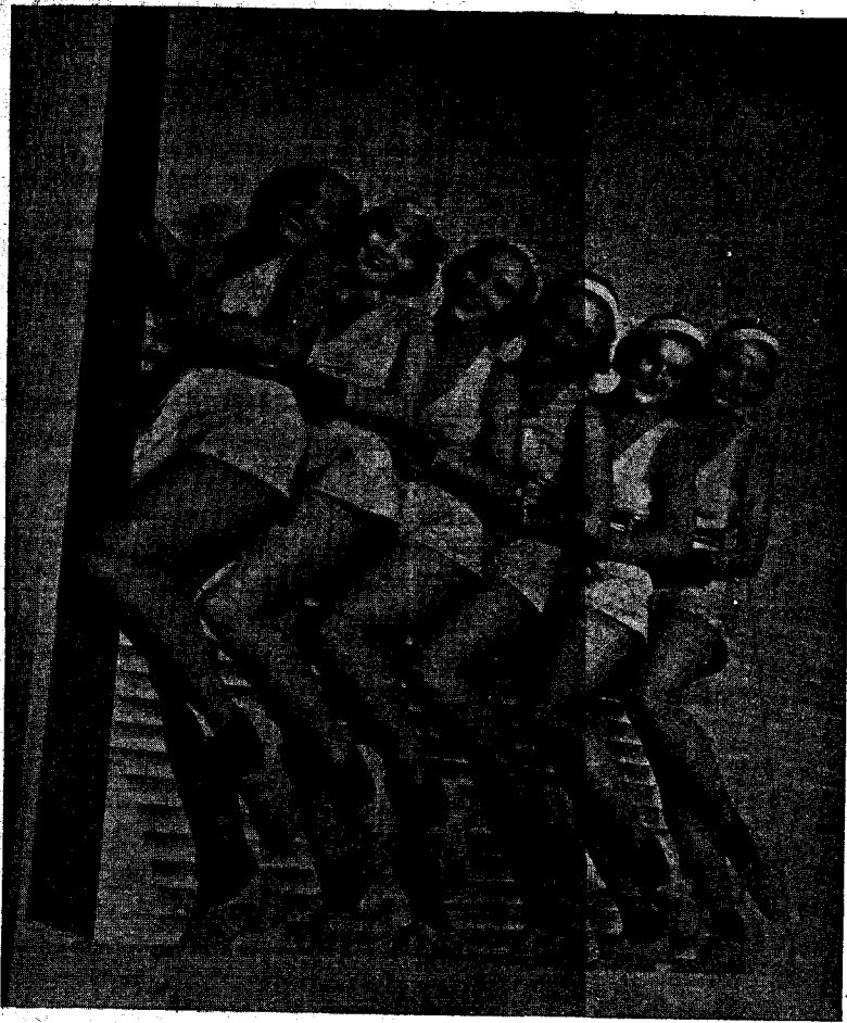
Un grapat de bellíssimes i esculturals «girls» que podreu admirar demà al Teatre Principal, en MÚSICA Y MUJERES