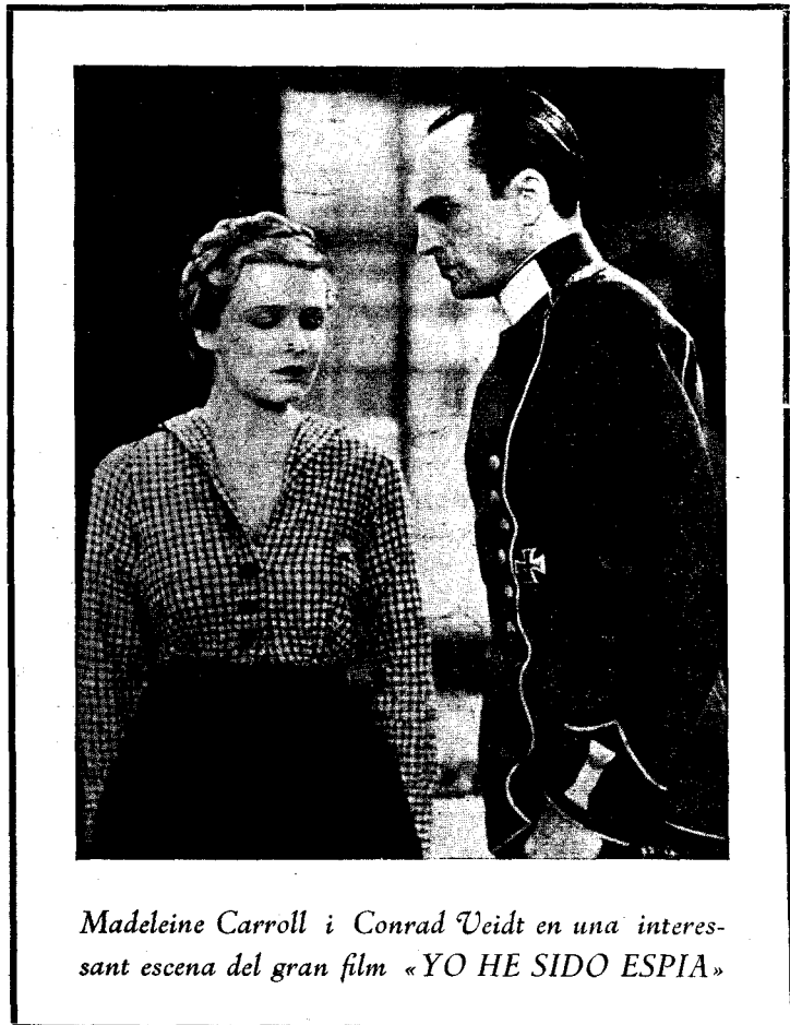
Madeleine Carroll i Conrad Veidt en una interessant escena del gran film «YO HE SIDO ESPIA»

YO HE SIDO ESPIA. La història verídica d'una noia que es veu obligada a convertir-se en espia per amor i per salvar a la Pàtria. Un film d'heroïsme!! Una epopeia de la gran guerra!! Un film úic!!