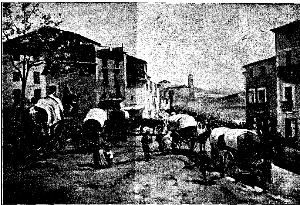
Tela de V. SOLÉ JORBA

V. Solé Jorba, amb paisatges d'Olot, ocupa una sala de can Parés. A remarcar alguna tela humida i ben construïda. Alguna tela mestra. També fragments de «bon ull» escampats per ací i per allà en moltes de les teles exhibides. Una agror rural desvalora certes teles més que lluminoses lluints, especialment aquelles en les quals l'artista recull els tons tardorals de les fulles dels arbres.