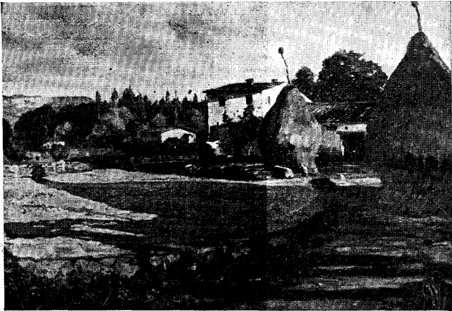
Paisatge olotí. - Tela de RAMON BARNADAS