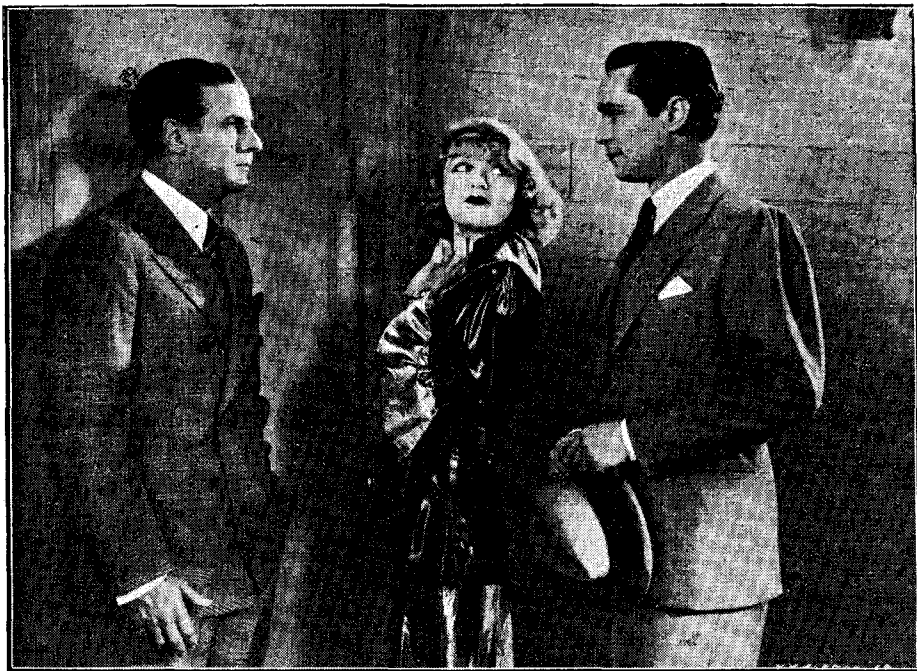
Una interessant escena de l'espectacular film «La Estrella del Moulin Rouge»