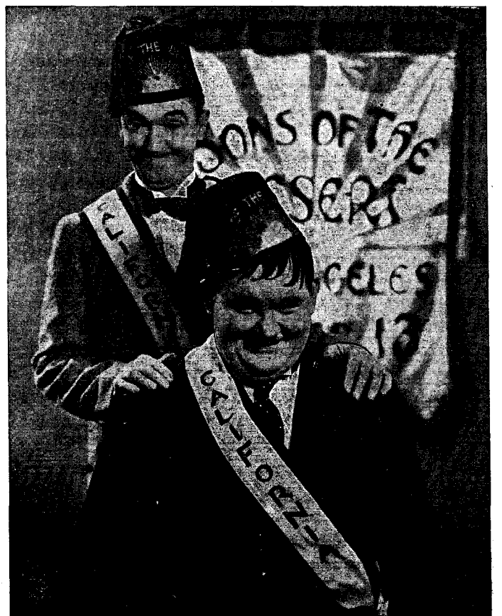
STAN LAUREL i OLIVER HARDY que molt aviat tornarem a admirar en un nou film

...al Cinema IDEAL PARK es projectà la producció dialogada en espanyol «Viva Villa!». Un film molt ben realitzat i en el qual es reviu les aventures del cabdill mexicà, encara que hi han escenes que fugen de la realitat per excès de conveniència del director. Es digne de lloances el formidable treball de Wallace Beery, en el paper de protagonista.