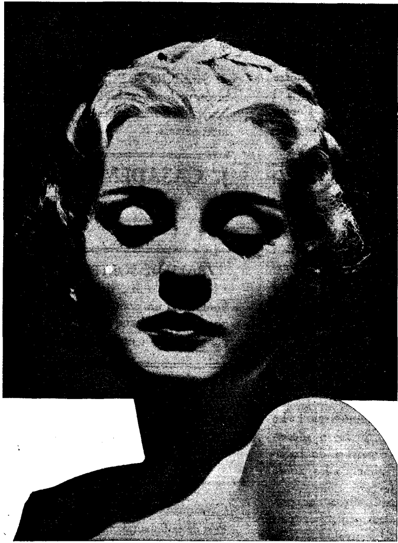
ANNA STEN, la famosa actriu russa que acaba de rodar una nova producció d'envergadura amb un èxit sorollós