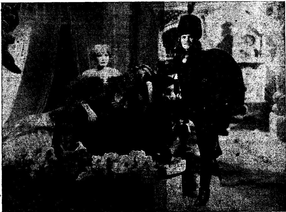
Marlene Dietrich en la fastuosa pel·lícula CAPRICHIO IMPERIAL que molt aviat es projectarà al Cinema Ideal Park