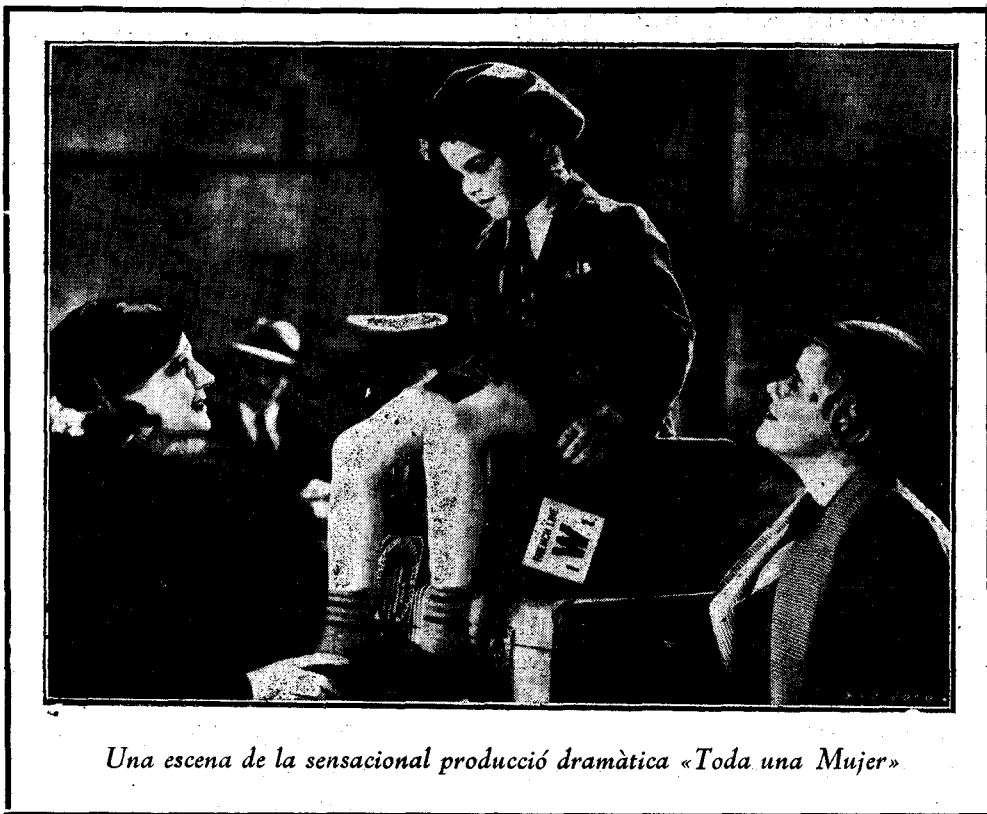
Una escena de la sensacional producció dramàtica «Toda una Mujer»