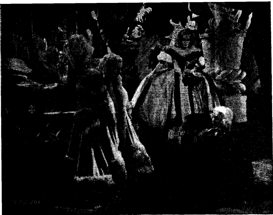
Una escena de l'espectacular pel·lícula CAPRICHIO IMPERIAL , que es projectarà aviat en el Cinema Ideal Park