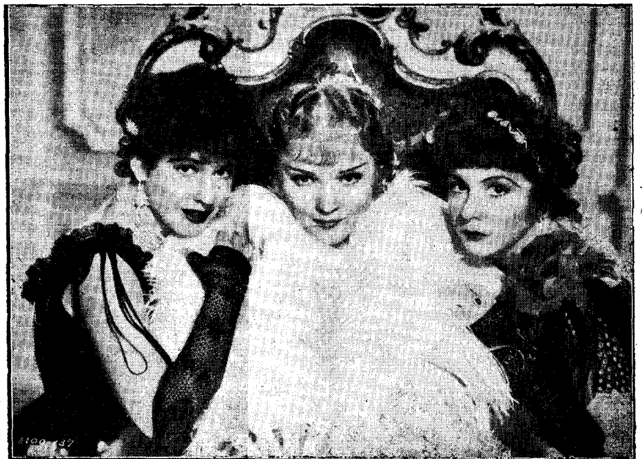
Una escena de la sensacional producció LA DAMA DEL BOULEVARD