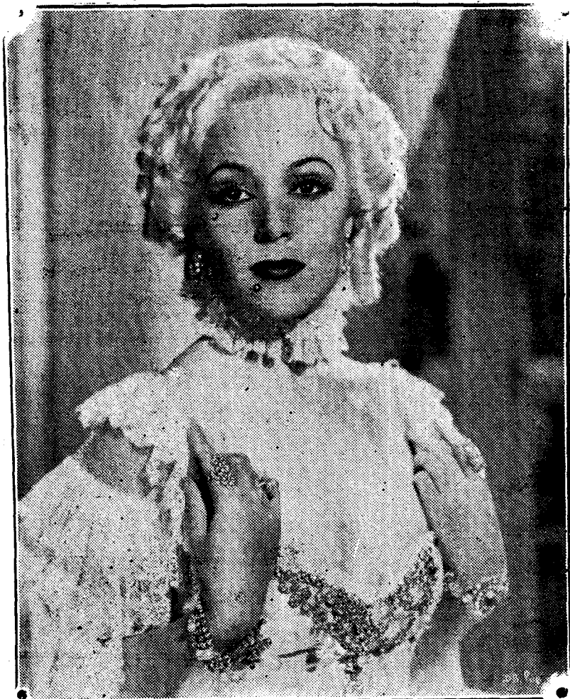
DOLORS DEL RIO, la genial protagonista de «Madame Du Barry»