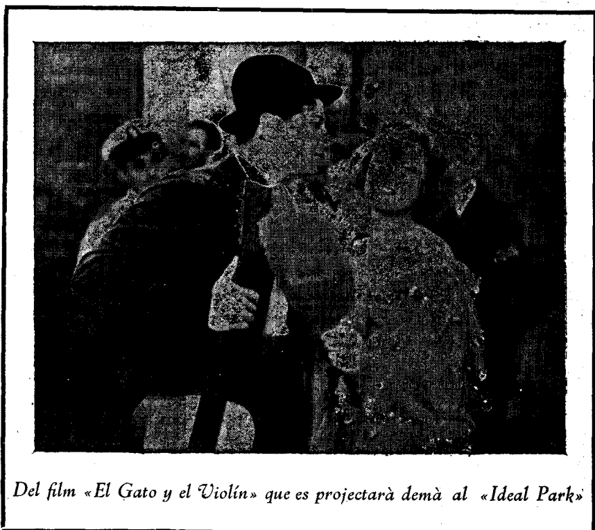
Del film «El Gato y el Violín» que es projectarà demà al «Ideal Park»

...al CINEMA IDEAL PARK, «La Gran Duquesa Alejandra» és la història d'una vida aristòcrata interpretada per Mary Jeritza i Paul Hartman. «Alicia en el país de las Maravillas» és el conte del mateix nom portat al llenç. Es un film per a infants que no va arribar a convèncer-nos. La simpatia de Charlotte Henry salvà una mica el film que amb tot i el gran nombre d'estels que hi figuren no passa d'ésser propaganda americana.