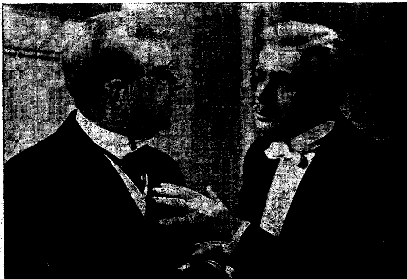
Paul Muni en una escena del grandios film «El mundo cambia»