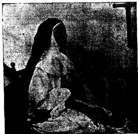
Una escena de «Canción de Cuna»

... al TEATRE PRINCIPAL, es projectà el film dels Artistes Associats «La Màscara del otro». Es una llàstima que sigui tan mal doblat en castellà. Elissa Landi tan actriu com sempre i Ronald Colman més artista que mai. «Paso a la Juventud» per Jan Kiepura i Marta Eggerth. Jan Kiepura ens demostra una vegada més el que pot fer cantant. «Paso a la Juventud» és un film que mereix qualificar-se dintre la categoria de «Hoy o nunca» i «Todo por el amor» Aquesta producció és una continuació d'imatges i perspectives molt ben resoltes.