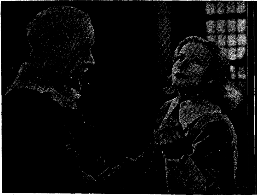
Greta Garbo en una escena del film Metro Goldwyn «La Reina Cristina de Suècia»