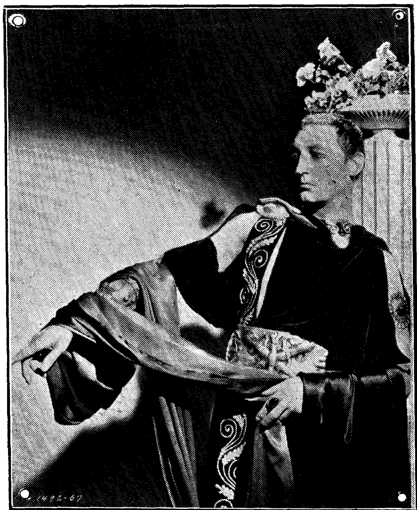
El gran actor Warren William, en una escena del film CLEOPATRA