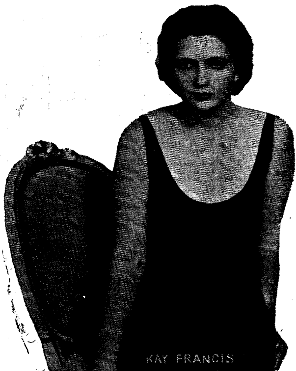
l'intel·ligent protagonista del film WONDER BAR, que veurem demà al Teatre Principal.