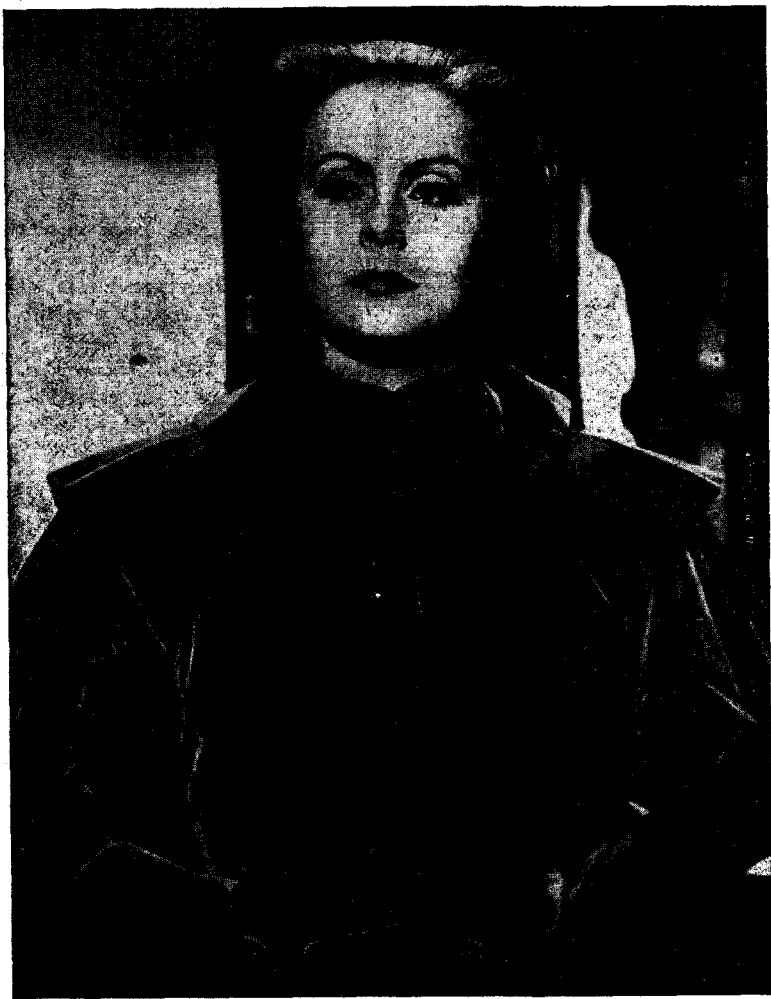
GRETA GARBO, en «La reina Cristina de Suecia»