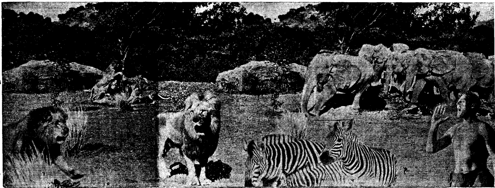
De la pel·lícula «Tarzán y su compañera», interpretada per Jhonny Weissmuller i Maureen O'Sullivan