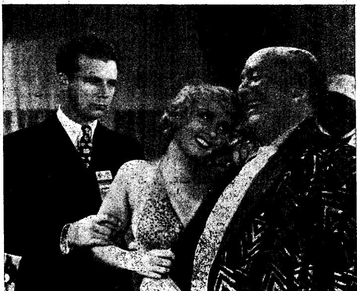
¡QUE SEMANA! divertidíssima comèdia interpretada per Dick Powell, Joan Blondell i Guy Kibbee

vegades surten els records. Un any després, Maurice Stiller el gran director suec, cridà a Brisson per a encomanar-li el primer paper de «L'expiació de Greta Berling». No fou poca la sorpresa de l'actor al trobar-se amb que l'actriu elegida per acompanyar-lo en la interpretació d'aquesta obra era Greta Garbo, l'admiradora a qui ell havia presentat a Stiller algun temps enrera. En 1922 Stiller passà a Hollywood amb Greta, de la qual no tornà a saber-ne res més fins a Carl Brisson fins passats sis anys, quan en l'estrena d'una de les seves pel·lícules a Londres es trobà amb la que ja era la cèlebre Greta Garbo. Per cert que al veure com es saludaven efusivament, algun amic de l'actor li preguntà: —Però què, ¿coneixia vostè a la senyoreta Garbo? —¿Garbo?— digué Brisson sorprès. —I jo que creia estar parlant amb Greta Gustafson, la meua amigueta d'Estocolm! Debuta a la pantalla amb «El crim de Vanitats» i fa en aquesta grandiosa pel·lícula un paper de trobador romàntic... Va ésser campió de boxa d'Europa abans de dedicar-se al teatre, i tenia només dotze anys d'edat quan va sortir el seu retrat als periòdics per haver salvat a dues nenes que estaven a punt de morir ofegades. Ultimament un grup de les seves admiradores de Londres va volguer portar-lo al Parlament anglès, al que s'hi negà perquè la responsabilitat del càrrec l'impedia ésser actor de cinema i això no ho vol deixar-ho per res ni per ningú.