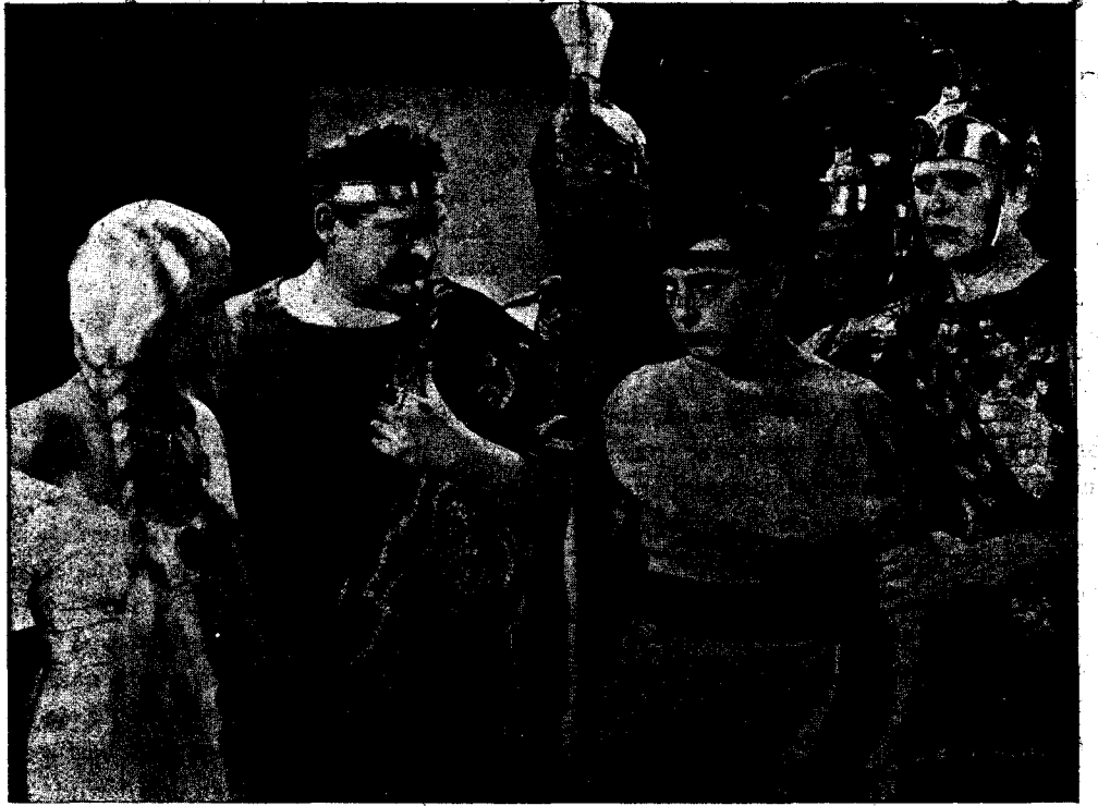
ESCÁNDALOS ROMANOS, el film que podreu admirar demà al Teatre Principal

... al TEATRE PRINCIPAL, «A la sombra de los muelles», per Ben Lyon, Claudette Colbert i el malaguanyat Ernest Torrence. Es un film de contrabandistes que distreu. «Fruta Verde». Es un film musical que en tot i que es feu una mica pesat en algunes escenes, va agradar perquè es tractava d'un tema distret i ben resolt. Franziska Gaal, en el paper de protagonista, ens mostrarà que continua essent la bona artista i excel·lent cantatriu que va ja imposar-se en el seu primer film «Pàprika». La música molt inspirada.