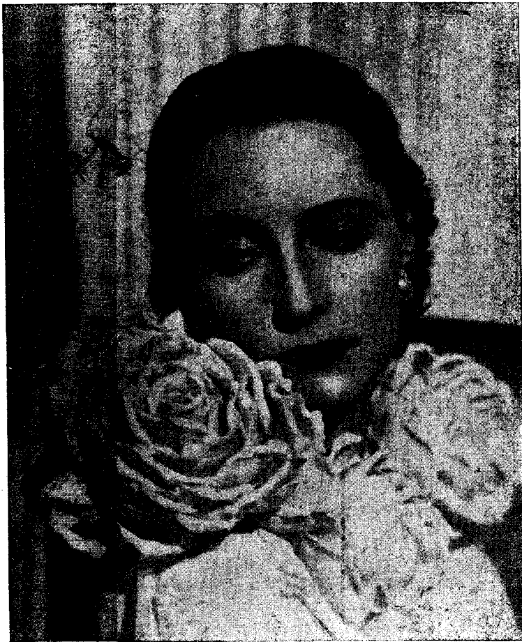
La bellíssima Dorotea Wieck, creadora de «Canción de cuna»