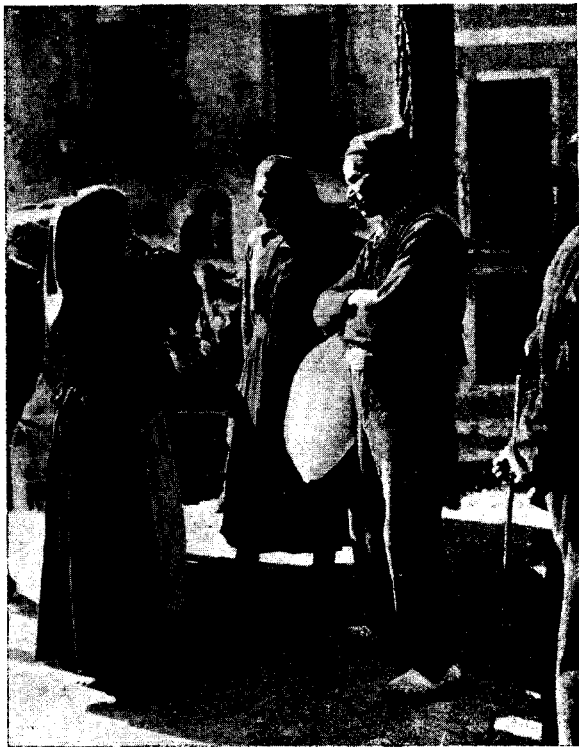
FIRES DE SANT LLUC