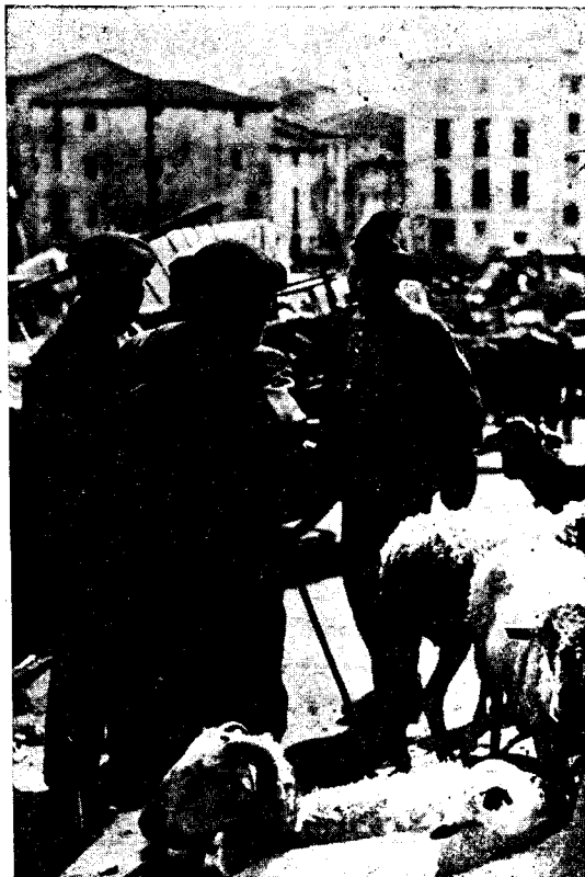
FIRES DE SANT LLUC

Podem donar gràcies al cinema, si avui per a molts no els és vedat fer objeccions crítiques davant aquesta nova modalitat de l'art fotogràfic. En contra del què alguns suposaven, en poc temps l'hem vist progressar remarcablement, i encara que sembli una paradoxa, ens atrevim a dir que la clau d'aquesta evolució ascendent no ha estat altre que la d'haver sabut restar importància en els elements els quals se'ns presentaren essencialment fidels a la nostra visió natural dels objectes. Ha estat necessari, i el cinema, ho demostra abastament, per tal de que hom pugui emprar el mot d'art en la fotografia, equilibrar els mitjans objectius i subjectius, del contrari hauria estat ben difícil d'evolucionar amb sentit progressiu.