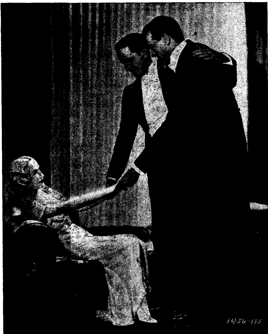
Una interessant escena del grandios film «Una mujer para dos»

tina un final tan desgraciat. Lewis Stone en el paper del Canciller Oxentierm, se'ns mostra l'artista, el domini i justesa interpretativa del qual, l'ha fet conquerir el lloc preeminent que ocupa avui en la cinematografia. "Cristina de Suecia" és una pel·lícula recomanable per tots aquells que en cada film hi volen descobrir l'habilitat dels directors i el depurat treball d'uns artistes que no desenganyen mai, sinó que és norma seva el superar-se en cada un dels personatges que interpreten. Els amors de Cristina de Suecia i Antoni Pimentel del Prado, són viscuts de manera tan sublim per Greta Garbo i John Gilbert que emociona profundament. Sembla com si ajuntats altra volta aquesta parella, que tant havia fet parlar als aficionats al setè art, hagin volgut aprofitar aquesta avinentesa per tal de fer-nos sentir novament tota la bogeria i felicitat d'un amor impossible... En fi, és una pel·lícula que recomanem a tothom.