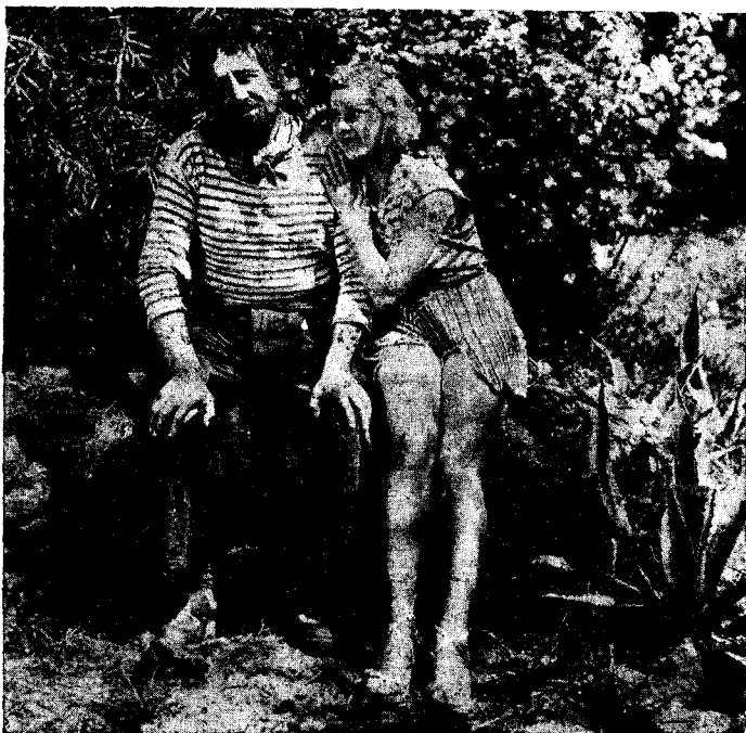
Mary Glory i Raimú en una escena de «Carlo Magno»

Per primera vegada apareixeran, en un mateix film, tres artistes premiats per l'Acadèmia d'Arts i Ciències cinematogràfiques: Norma Shearer, Fredrich March i Charles Laughton. Norma Shearer fou premiada l'any 1929 pel seu paper de dona traïcionada en el film «La Divorciada». Fredrich March ho fou l'any 1932, de resultes del rol de doctor en la cinta «Dr. Jekill and Mr. Hayde», que es presentà al nostre públic amb el títol de «El hombre i el monstruo». En aquest film, Fredrich March, té al seu càrrec el paper de Dr. que arriba a separar l'esperit del bé i el del mal. En aquest film, Fredrich March, ens dóna a conèixer l'extraordinària predisposició que té pels films d'aquesta mena, que són els que li preferim. Aquest jove actor s'havia revelat en «El amor no muere» amb Norma Shearer, i en «Strangers in Love» on encarna rols de doble personalitat. Charles Laughton és el més novell guanya-