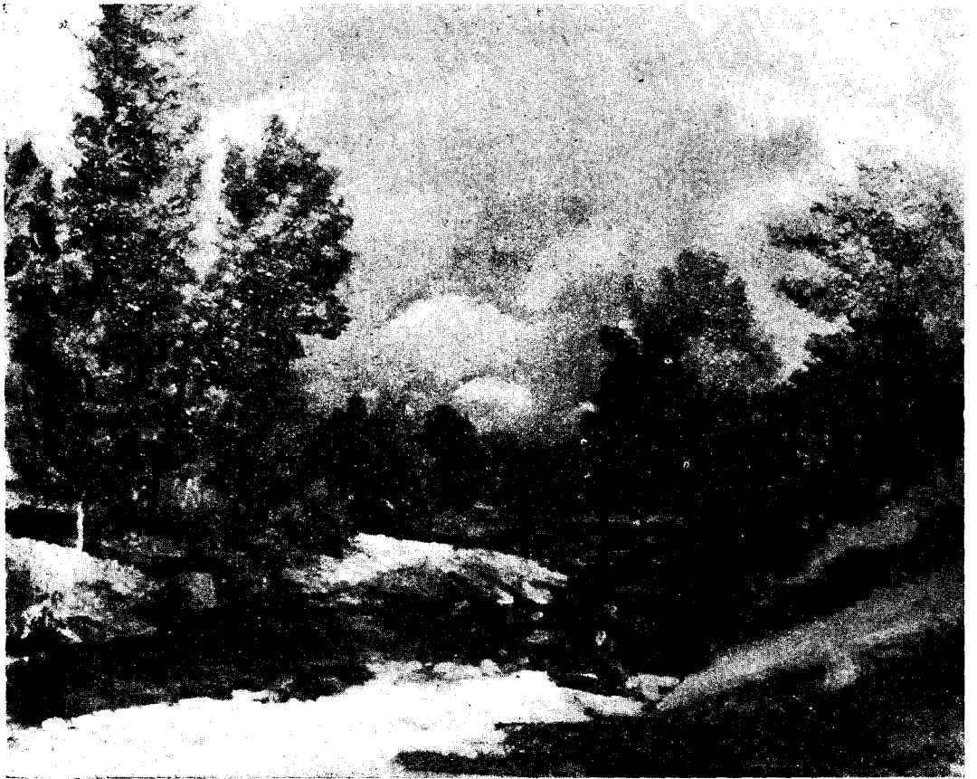
Paisatges olotins: Oli de J. Marsillach

El quadro, que generosament ha ofert el nostre artista, està exposat als aparadors de la Casa Munteis—carrer Francesc Macià—i serà sortejat el dia 15 del corrent.