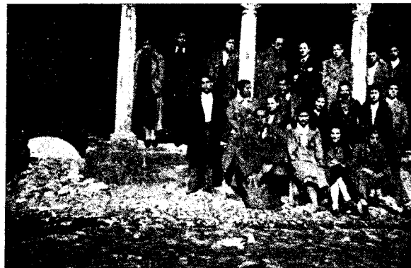
Grup d'estudiants que prengueren part a la vetllada teatral.