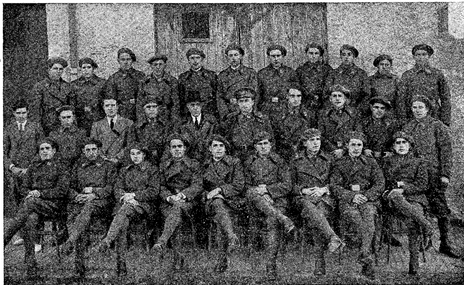
Un grupo de alumnos del curso de 1931