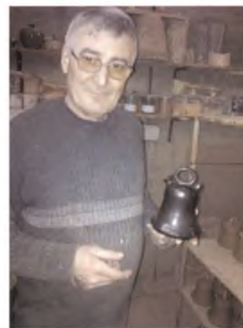
ARTICLE I IMATGE : EL CELRÈ

Cal comentar que l'artista Bonaventura Anson, serà l'autor del cartell d'aquesta mateixa fira.