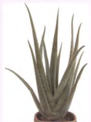
ARTICLE ESCRIT PER: ÚRSULA MADUEÑO