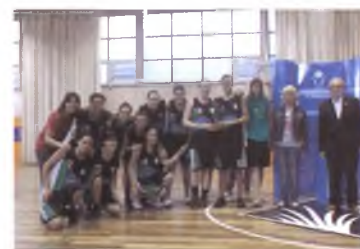
ARTICLE I IMATGES: CB QUART

Gràcies per la vostra paciència i les ganes de seguir treballant perquè el nostre club ocupi un lloc en el mapa basquetbolístic gironí i català. Ho aconseguirem !!