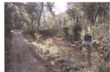
MOLÍ D'EN RIGAU