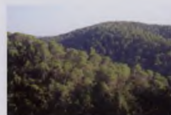
PINEDA APROP DE CAL BOSQUETÀ

FOTO CAPÇALERA: SUREDA A ST. MATEU DE MONTNEGRE