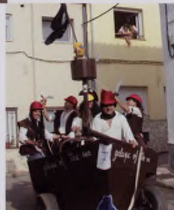
ARTICLE I IMATGE: LA COMISSIÓ DE FESTES DE PALOL D'ONYAR

Gràcies a tots per col·laborar i participar-hi i fer que tot això sigui possible!