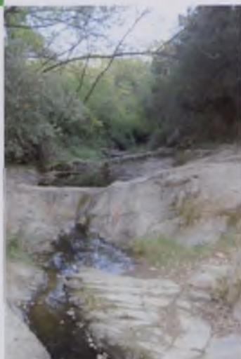
LES GORGUES DEL SANT PARE DEL CELRÈ