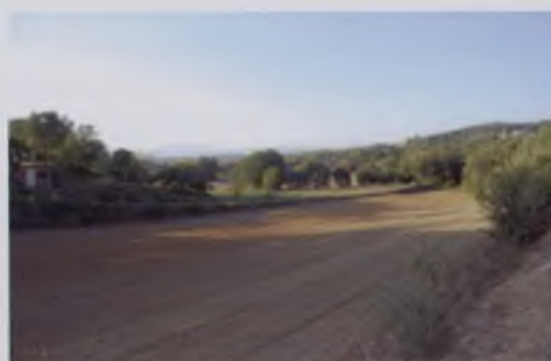
CAMPS DE CONREU AL RAVAL

Els espais urbans són un dels indrets amb menys diversitat, per bé que moltes espècies aprofiten aquests indrets per criar-hi (masos, cases aïllades, cases abandonades...). Sovint, es troba fauna molt confiada, o espècies que aprofiten la manca de depredadors per instal·lar-s'hi. Els jardins de moltes de les cases de Quart ofereixen uns hàbitats fantàstics per acollir i amagar ocells fringíl·lids i passeriformes. Sovint es poden veure si s'instal·len caixes niu o menjadores.