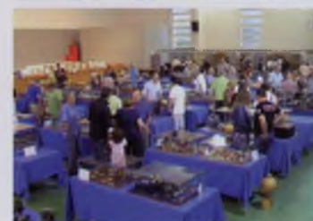
ARTICLE I IMATGE: AMICS DEL COL·LECCIONISME DE QUART