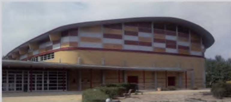
NOU ASPECTE DEL PAVELLÓ