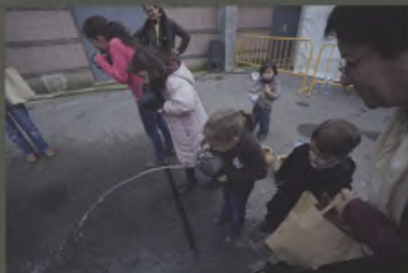
Jocs pels més petits