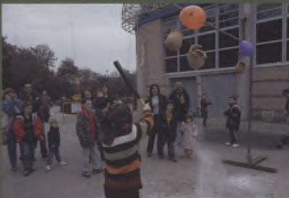
Jocs de cucanya