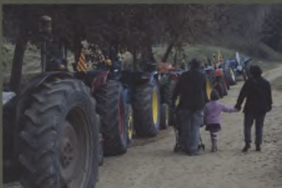
Concentració de tractors antics