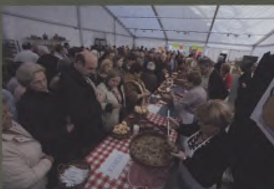
Degustació de cuina tradicional amb les cuineres de Sils