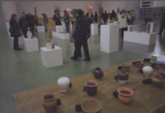
Exposició de peçes ceràmiques