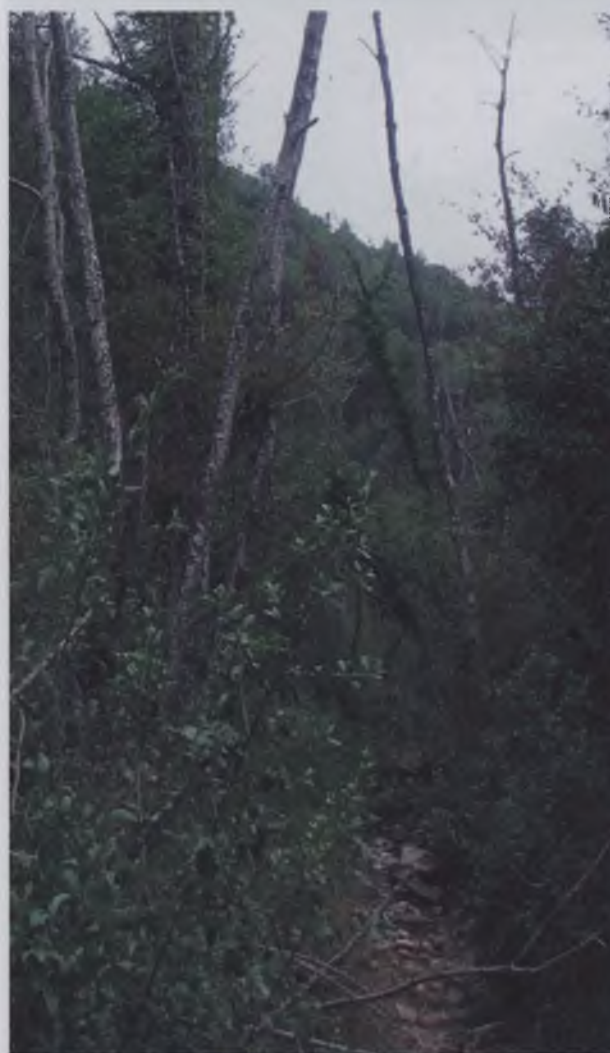
Imatge del bosc de ribera afectat, just al pas tragner: Juny de 2006.

Replantada de freixes i verns per recuperar un mínim bosc de ribera resseguint el curs del Celré. El creixement dels arbres hauria de permetre de recuperar unes condicions d'ombra favorables per a la recuperació de nombroses plantes herbàcies del sotabosc.