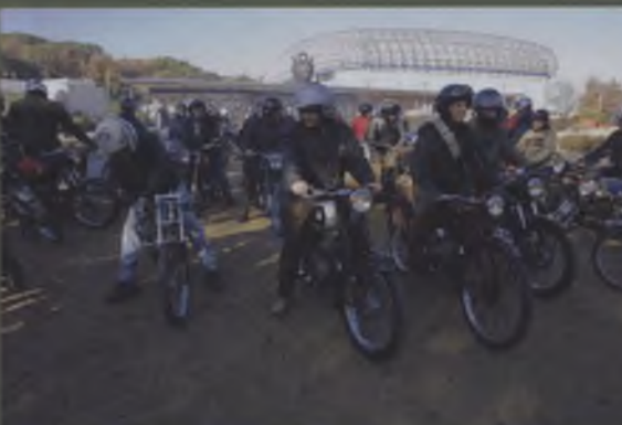
Concentració de motos antigues