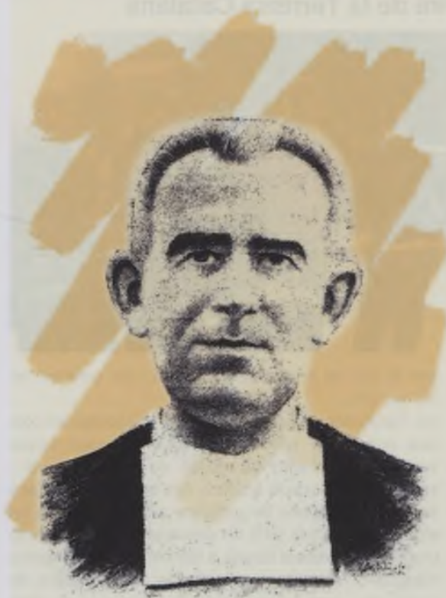
Narcís Serra i Rovira

Màrtir és el cristià que ha acceptat voluntàriament la mort per amor a la fe, infligida per qui manifesta odi a la fe o una virtut relacionada amb la mateixa.