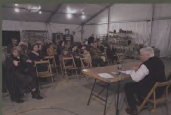
Conferències sobre la cuina amb terrissa