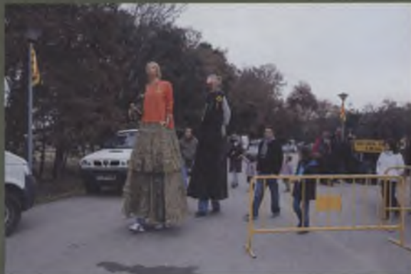
Cercavila amb els gegants de La Creueta i el grup de percussió Tamborians

A més a més, però, la fira ha comptat amb moltes més activitats paral·leles que s'han dut a terme a una carpa al costat del pavelló municipal, o bé a l'exterior d'aquest recinte. Aquestes en són algunes: