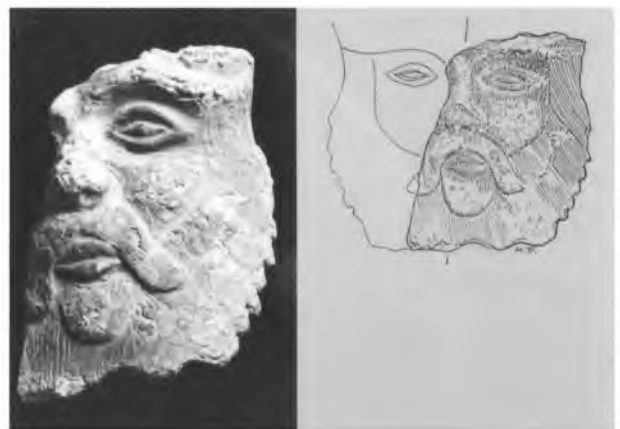
Relleu en bronze del déu Bes que anava recobert d'una placa de plata.

Els ibers de la Creueta pertanyien a la tribu dels indiketes , tal com s'anomenen els pobles d'ibers de l'Empordà i de la costa. Les altres tribus més properes eren els ausetans (de la plana de Vic) i els Laietans (del Maresme). Així en donen testimoni les restes de ceràmica que s'hi van trobar, com els plats de producció pseudojònica fabricats exclusivament a Ullastret, ceràmica grega de figures roges, ceràmica feta a mà del tipus de costa catalana amb cordons en relleu i les àmfores de procedència púnica i massaliota (de Massàlia, avui Marsella), destinades a