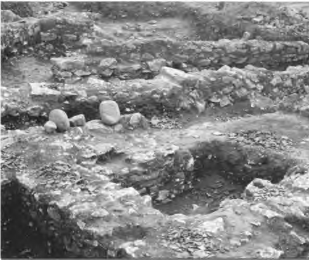
Fonament de pedra d'una de les cases.