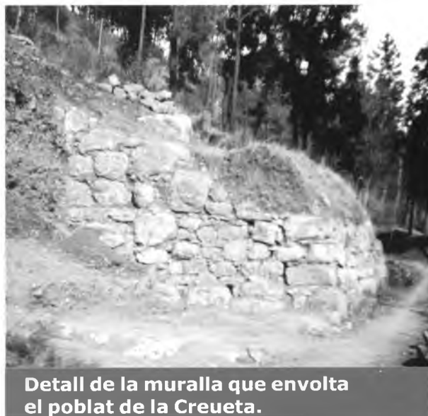
Detall de la muralla que envolta el poblat de la Creueta.

sòl i donar solidesa a la construcció. Es feia servir la pedra en blocs regulars, unida amb argila i introduint petits tascons entre els espais dels blocs. La part superior dels murs es construïa en toves, una barreja d'argila, sorra i palla dins d'un motlle de fusta assecada al sol. Per aquests rodals també es construïa amb un sistema dit de tàpia el qual feia servir un calaix de fusta omplert d'una massa d'argila sorra i pedra tot ben trepitjat. Les teulades eren inclinades, per facilitar l'evacuació de l'aigua de pluja, amb un