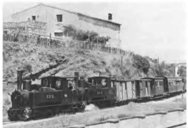
El carrilet, al seu pas per la Creueta.

segons la seva gruixària i pes. Després es renta el gra per immersió i es centrifuga.