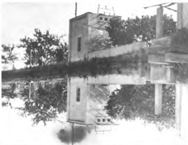
Canal de conducció i la bassa del molí.

Els que hagin vist el museu farinera de Castelló d'Empúries es faran una idea de com funciona una farinera (3). La mòlta gradual per cilindres es divideix en tres fases: la neteja, el condicionament i la mòlta pròpiament dita. La neteja del blat té per objectiu separar el gra de la palla, pols, pedres i llavors que es barregen amb la sega del blat. El procés de neteja es fa en un torn de decantació i un sistema de garbells que treu les impureses