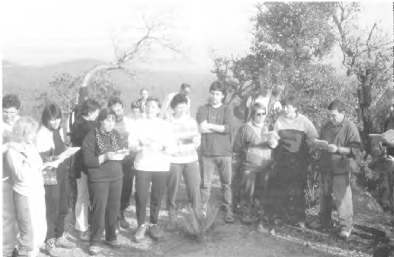
Cantada de nades a les Roques del Mal Pas.