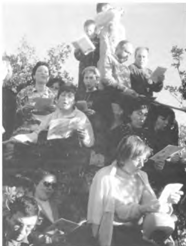
Pessebre a Montigalà.

Itinerari: Deixarem els cotxes a Tues i seguirem el riu fins a uns 6 quilòmetres en direcció a Carança tornant pel mateix camí.