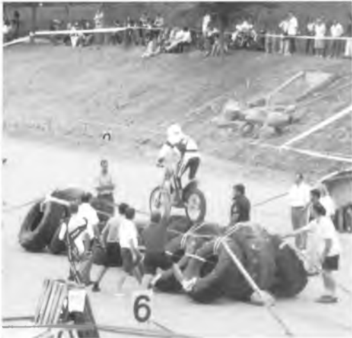
na imatge del 1r Trial Indoor Vila de Quart, que s va fer al camp de futbol del nostre poble l'any 1997.

pilot, mirant de corregir les errades que ha detectat en la competició, i a les curses, a més de vetllar per la seguretat i portar una motxilla amb aigua, menjar, recanvis i eines, ja que s'ha d'encarregar d'arranjar les avaries i qualsevol imprevist que es pugui produir, ha d'intercanviar opinions, discutir, aconsellar, guiar i motivar al pilot a l'hora de fer una zona".