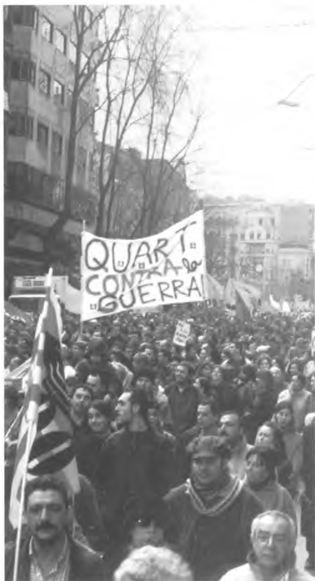
Membres de Solidariquart van participar, en representació del poble de Quart, a la manifestació a favor de la pau que va tenir lloc el passat 15 de febrer a Girona.