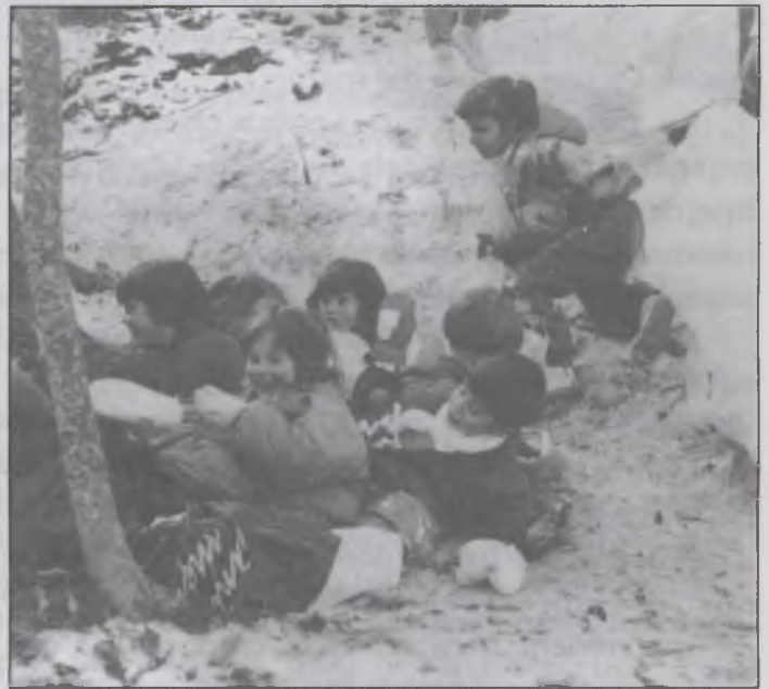
Sortida al Montseny, a la neu.

i va servir per estudiar diferents autors catalans.