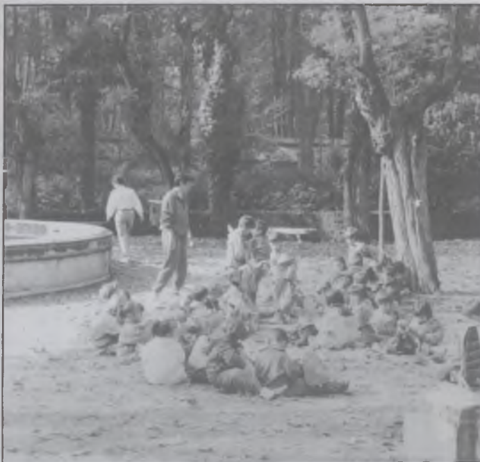
Sortida a les Fires de Girona

Per celebrar Sant Jordi, tota l'escola va participar en un treball literari, que es va organitzar per cicles