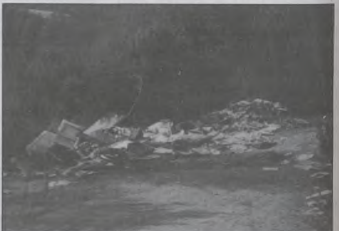
Un dels punts que s'hi han abocat deixalles.

Amb la col.laboració de tothom hi sortirem tots guanyant.