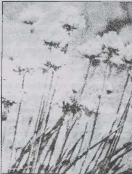
Les infusions són un gran relaxant.

sona. "Generalment els nens necessiten una mitjana de dotze hores, els adults únicament en precisen vuit, i a partir dels 50 anys, la mitjana és de sis hores, de totes maneres aquestes hores no són iguals per a tothom, hi ha persones que biològicament necessiten més o menys temps per descansar, tot i que el repòs diari és necessari per a tots. L'important no és la quantitat d'hores, sinó la qualitat del son".