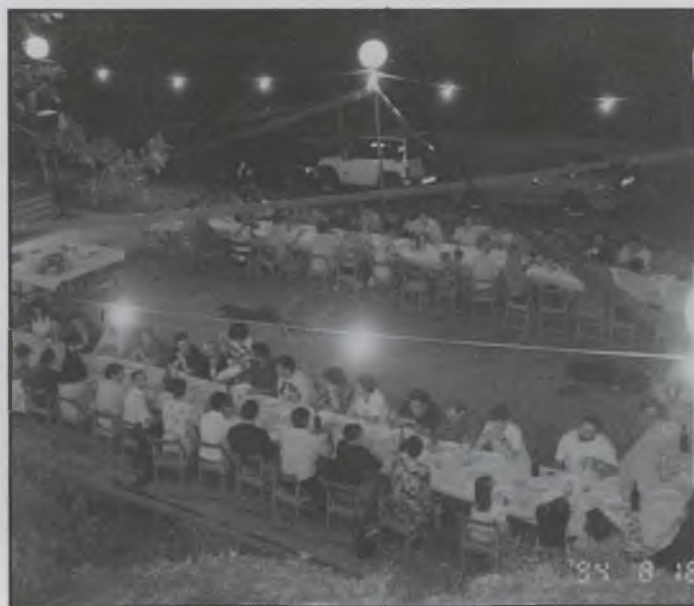
Sopar de fi de festa a La Creueta

Entre els actes programats, cal destacar la sessió de cinema que es va fer a l'aire lliure, una tirada local al plat, audició de sardanes, jocs per la mainada i sessions de ball. L'últim dia i com a cloenda de la festa, es va fer un suculent sopar de germanor, que va ésser tot un èxit, ja que a part de tenir una preparació molt ben acurada i un menú per llepar-se els dits, hi va haver una gran participació, tant de gent del poble, com de forasters i amics que varen voler participar. Al final del sopar es va fer un cremat per a tothom i un seleccionat ball de fi de festa. Esperem, doncs, que aquesta festa tan tradicional per La Creueta, es continuï celebrant amb aquest entusiasme i empenta que l'Associació de Veïns i jovent de la Creueta, li ha sabut donar amb tant encert.