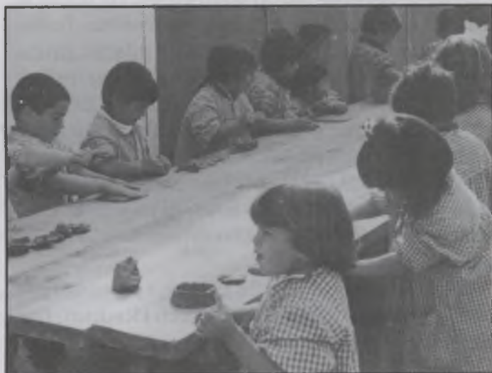
Nens fent figures de fang.

La Comissió Organitzadora agraeix novament a totes les entitats públiques i privades, empreses, comercials i als expositors i visitants, la seva presència, ja que any rera any, fan possible aquesta Fira.