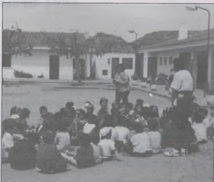
Colònies a l'Escola del Mar Marcel Maillot

També hem de donar les gràcies una vegada més a l'Ajuntament per ajudar-nos a mantenir