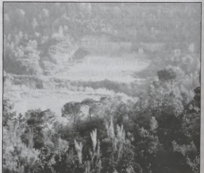
Estat actual del camp de tir, clausurat.

Ara cal esperar la resposta del Ministeri i intentar arribar a un acord que beneficiï els interessos del Municipi.