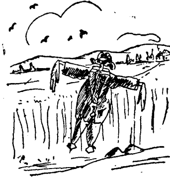
La nova esquena de caia Vila.

● S'Agaró sur mer. Platja de moda on aquest any s'hi han abocat gairebé tots els olotins.