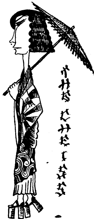
Una provable i gentil mascareta d'aquest Carnaval