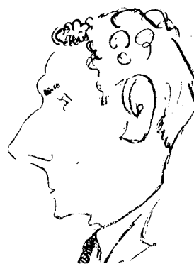
En Pere Barberí

Al mateix temps, ens pregunten convidem a tots aquells amics, especialment artistes, que per causes involuntàries hagin deixat de rebre l'oportuna invitació.