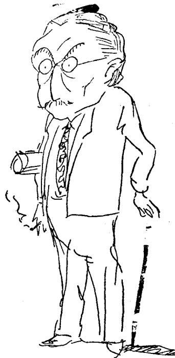
Ex-governador de Girona, que del Govern Civil se'n va anar a la Paperera... Olotina.

I per tal que consti, signem, rubriquem i cap al fard ho regarem tots els presents, a la ciutat d'Olot, a tres quarts de quinze, a l'any just de la seva naixença.—Mirililanu Iglesias i Campanars.—Jo EL DESPERTADOR.—En Pepito Xec i un altre Testimoni.