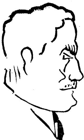
JOSEP PUIG I D'ASPRER