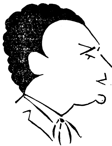
MANUEL CARRASCO I FORMIGUERA