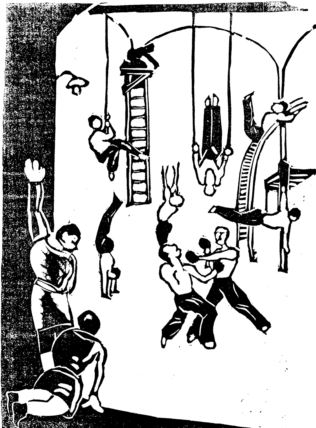
La redacció del «DESPERTADOR» entrenant-se, per a possibles lluites.

No admetem anuncis ni subscripcions :: :: que no es paguin per endavant :: ::