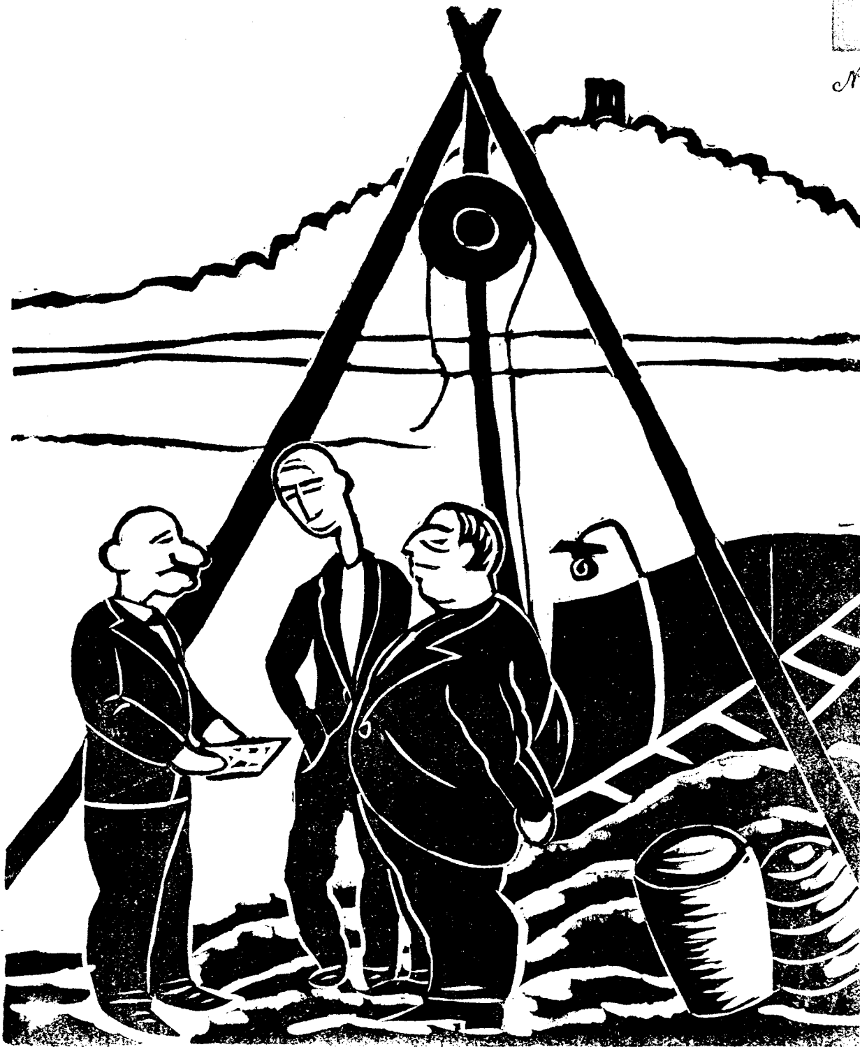
En els pous d'aigua del senyor Malagrida